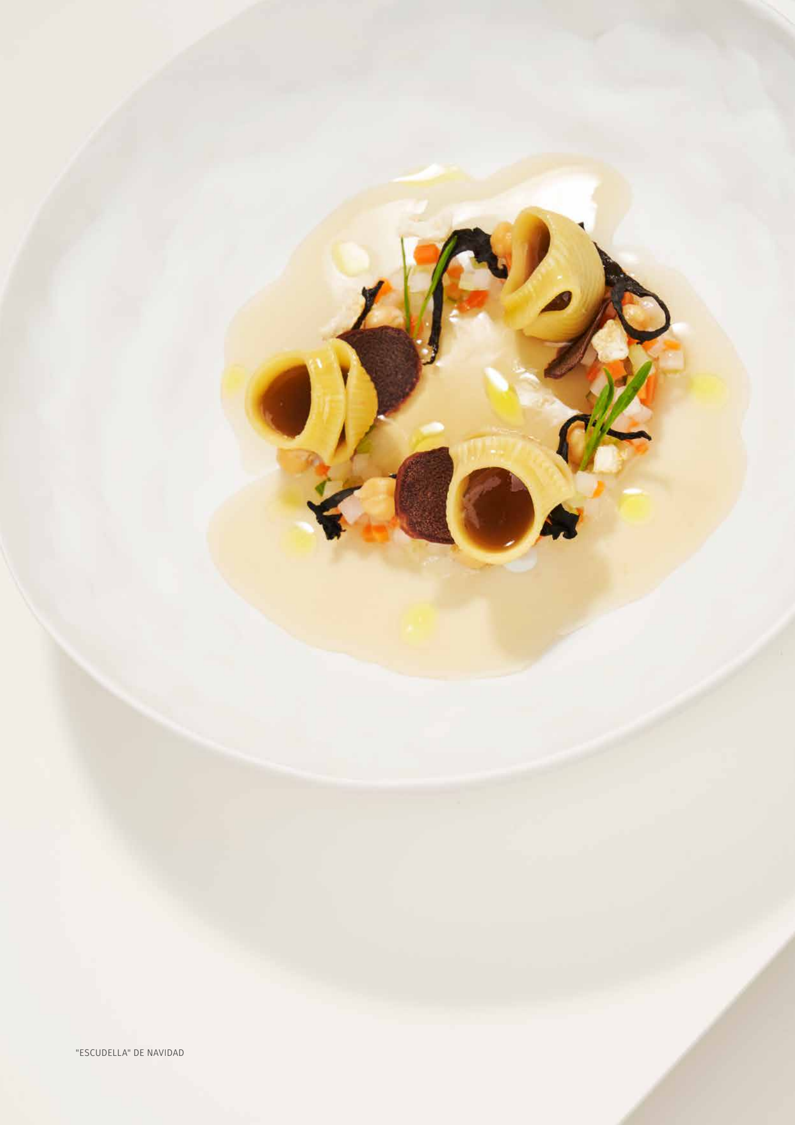
"ESCUDELLA" DE NAVIDAD