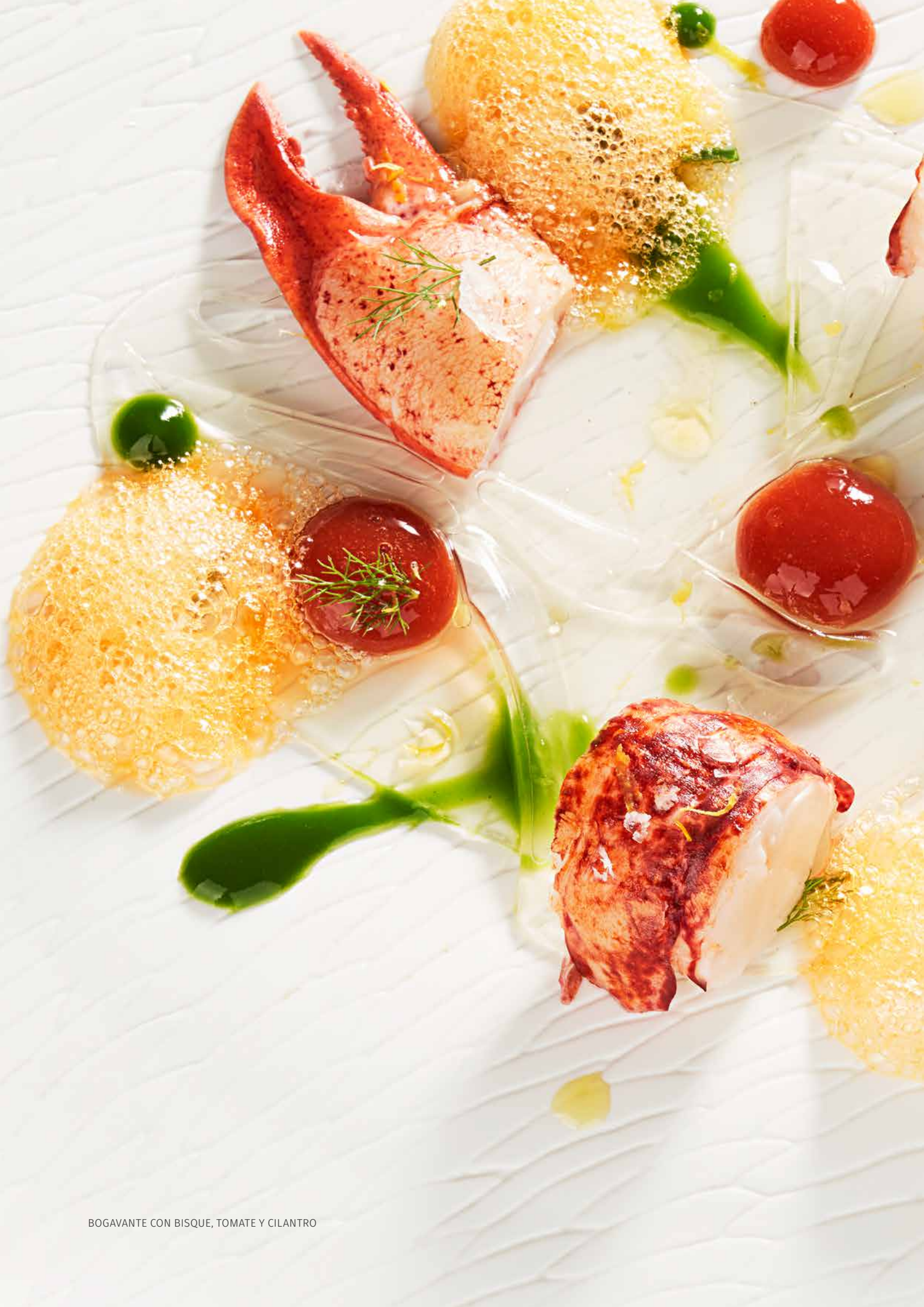
BOGAVANTE CON BISQUE, TOMATE Y CILANTRO