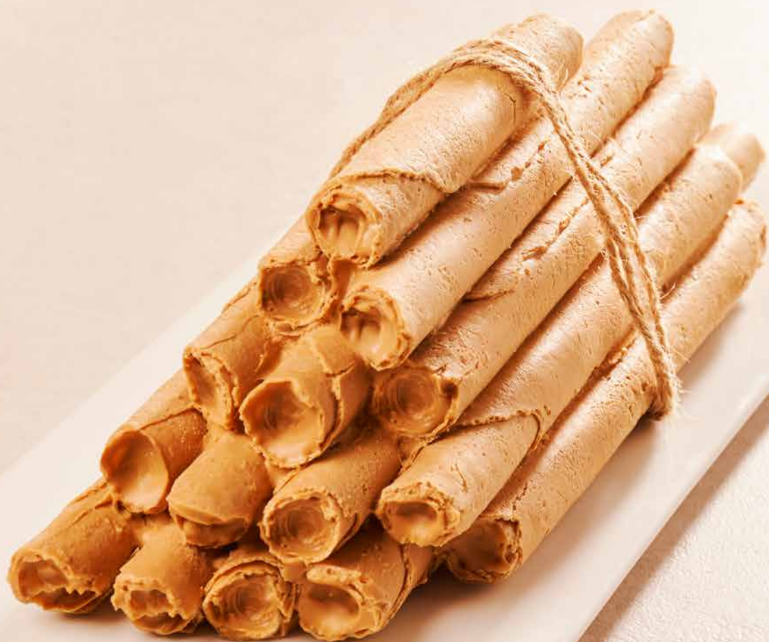
BÛCHE DE "NEULES"