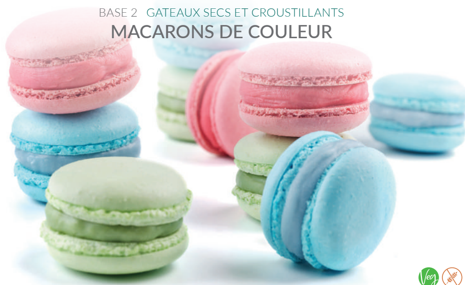
BASE 2 GATEAUX SECS ET CROUSTILLANTS MACARONS DE COULEUR