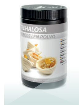
Alérgenos Sin alérgenos

Permite realizar gominolas y pâte de fruit con menos brix y más estables.