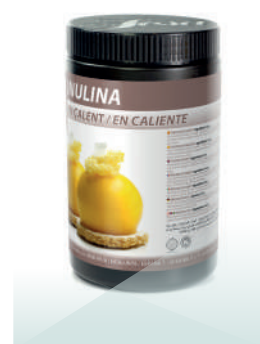
Alérgenos Sin alérgenos

Cremas y cremosos sin grasa. Reducción o sustitución de parte grasa en mousses, masas horneadas, helados, cremas y recetas en general.