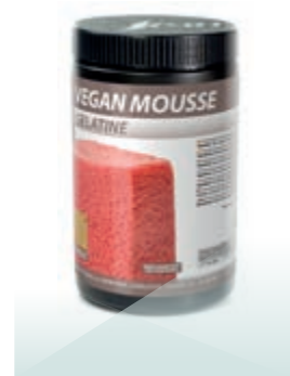
Alérgenos Sin alérgenos