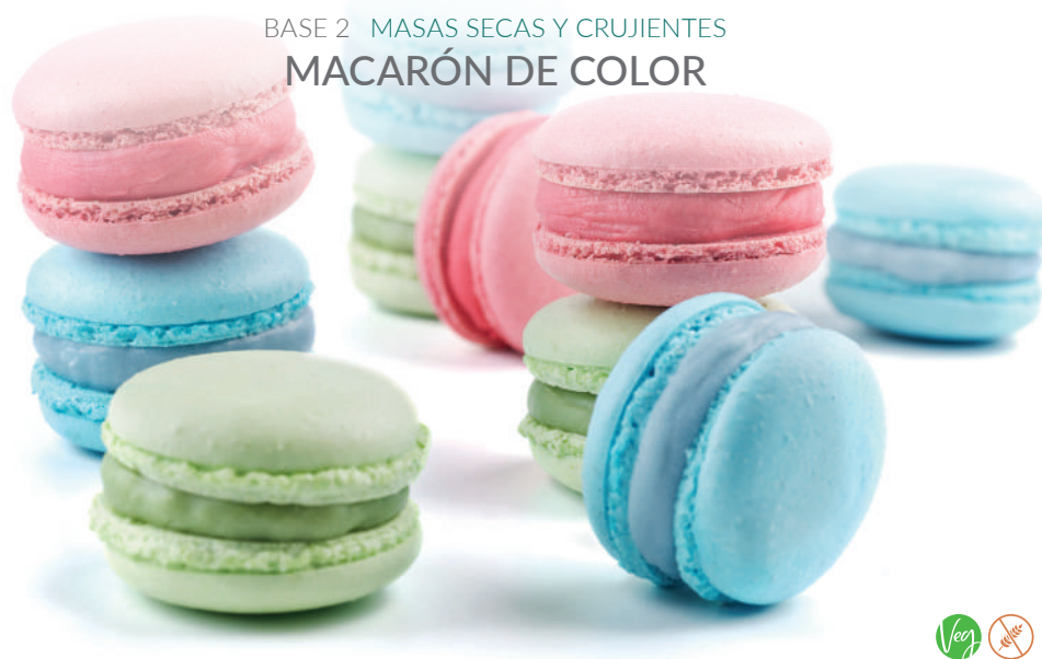
BASE 2 MASAS SECAS Y CRUJIENTES MACARÓN DE COLOR