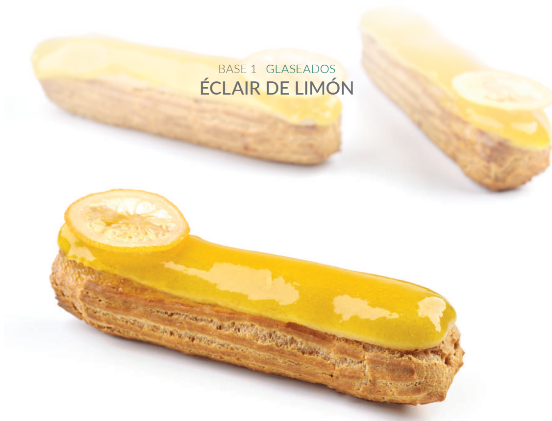
BASE 1 GLASEADOS ÉCLAIR DE LIMÓN