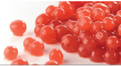
BASE 2 ESFERAS TERMOIRREVERSIBLES